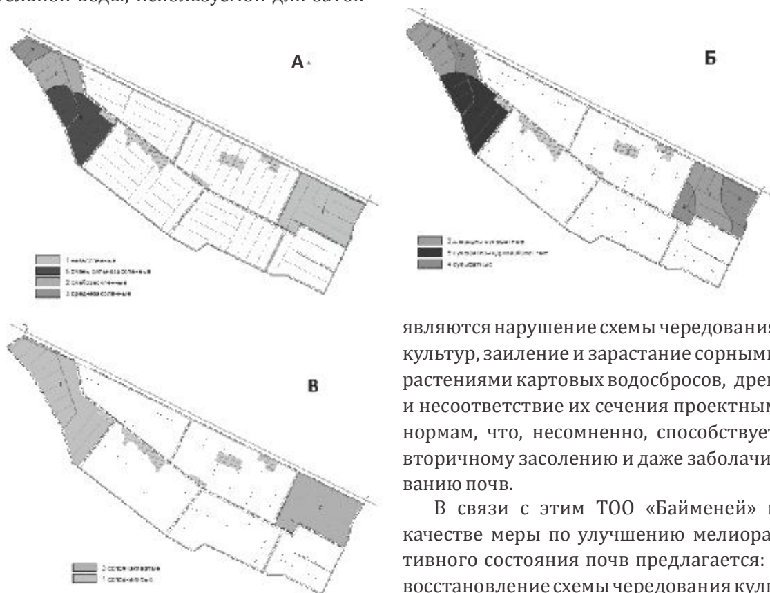
Рисунок 2 - Засоление почв ТОО «Отес» ( А - степень засоления, Б -химизм засоления и В - глубина залегания верхнего солевого горизонта)

ления посевов риса почвы 2-поля полностью перешли в разряд незасоленных. А площадь 7-ого поля, занятого люцерной 2-го года жизни, занимают слабо-, средне- и очень сильнозасоленные почвы. Основную площадь обследованной территории занимают почвы сульфатного типа засоления. По глубине залегания первого солевого горизонта почвы 2-го поля, вышедшего из под риса полностью относятся к солончаковым, а почвы 7-го поля занятой люцерной к солончаковым.