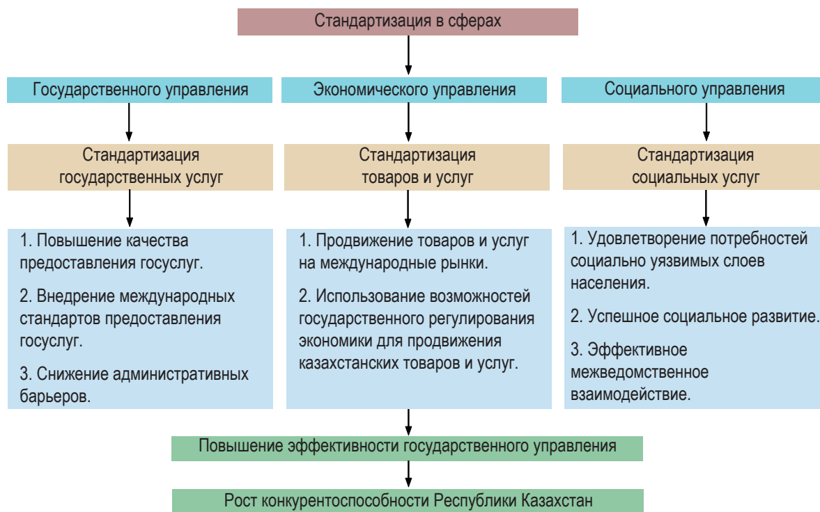
Рисунок 2. Стандартизация как фактор повышения конкурентоспособности Республики Казахстан [9, с. 65].

регулирования в настоящий период в полной мере не реализован, и это в то время, когда системная стандартизация государственных услуг в Республике Казахстан является активной антибюрократической мерой, повышающей доверие граждан к институту государственной власти и снижающей уровень административных барьеров.